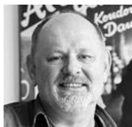
Peter Briggeler Sexualität und Gesundheit (bis April 2025)